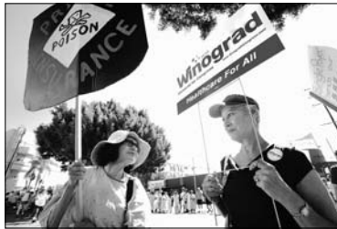
Con pancartas, los manifestantes presionan para mejorar el sector médico.

California podría ahorrar 344 mil millones en 10 años si aprueba el sistema de cuidado universal, según los doctores.