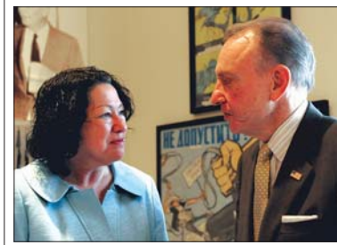
Sonia Sotomayor, nominada por Barack Obama a la Suprema Corte, habla con el senador Arlen Specter a principios de junio, en Washington, D.C.