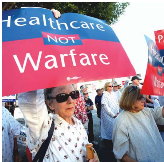
Simpatizantes de una reforma al sistema de salud se manifiestan en Los Angeles.